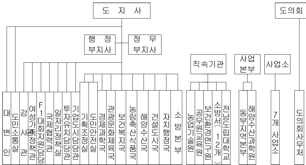
<표1-3> 전라남도 기구표

2실은 기획조정실과 도민안전실이고, 7국은 경제과학국, 관광문화체육국, 보건복지국, 농림축산식품국, 해양수산물국, 건설도시국, 자치행정국이고 1본부는 소방본부가 있으며, 도지사 직속으로 대변인, 도민소통실, 행정부지사 직속으로 감사관, 여성가족정책관, F1대회지원담당관이 있고, 정무부지사 직속으로는 국제협력관, 일자리정책실, 투자유치담당관, 기업도시담당관이 있다.