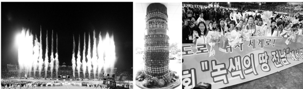
[그림설명 : “친환경녹색체전”연출 - 화약축포 대신 물기둥, 전남의 친환경 과일탑]

제89회 전국체육대회는 녹색의 땅 전남의 친환경이미지를 스포츠 행사에 처음으로 접목시킴으로써 전남의 깨끗하고 쾌적한 자연환경을 대내외에 알리는 계기가 되었으며, 저탄소 녹색성장을 선도해 나가는 정책의지를 보여주었다.